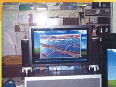
Monitoranzeige in der Hausmeisterloge in der Pausenhalle des Schulzentrums